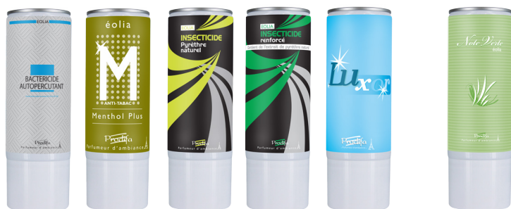
Behandlung / Treatment