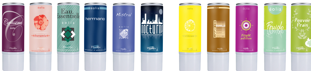
Edle Kreationen / Fine creations